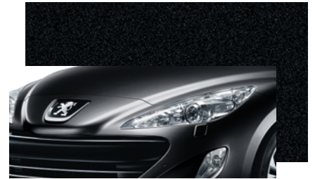
Perla Nera Schwarz